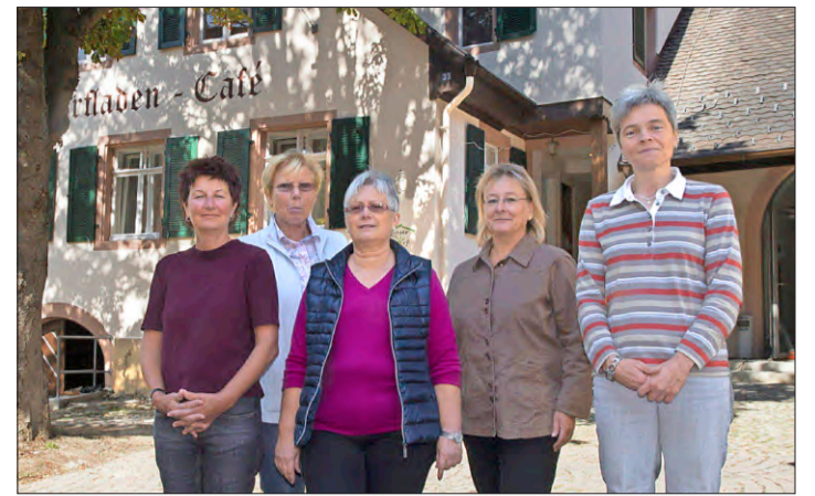
Fünf Mitarbeiter warten auf Kunden im Dorfladen.